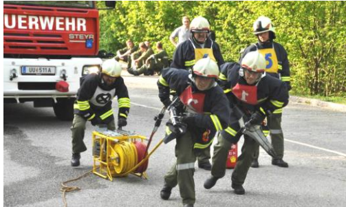
THL-Abnahme am Parkplatz in St. Gotthard