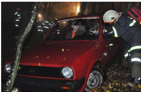
Herbstübung am Kreuzweg