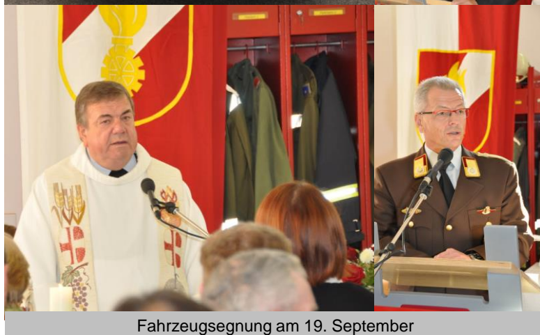
Fahrzeugsegnung am 19. September