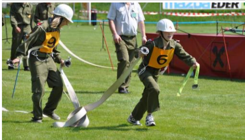
Abschnittsbewerb in Gramastetten