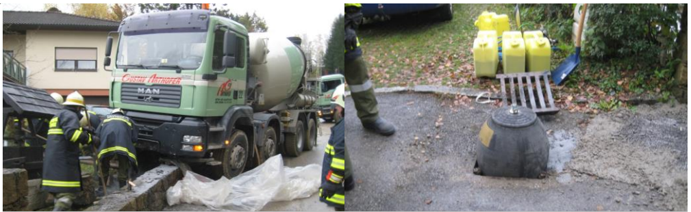
Einsatz Kreuzweg 2