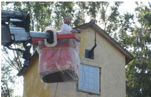
Renovierung altes FWH