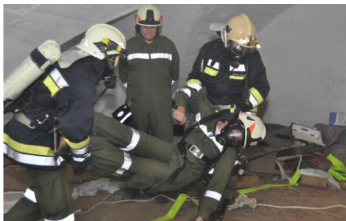
Atemschutzübung im Schloss Eschelberg