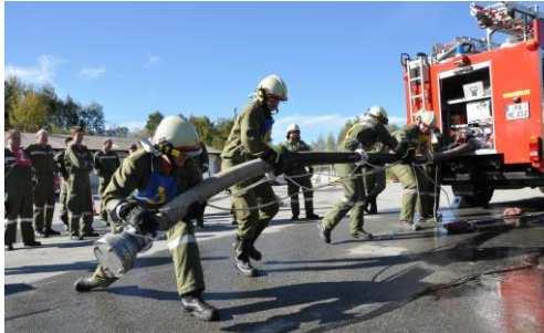
Bayerisches LA in Eging am See